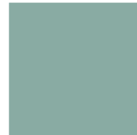
Green Jade 43770 - Old School