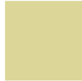
Sand wisp 42970

مغامرة جديدة، زهور تتفتح، مولد طفل صغير، بدايات جديدة استودينا منها مجموعة من الألوان الدافئة، الأرق الفاتح و الوردي مع اللون الأصفر تترابط بخيوط ناعمة من اللون البني و الأرجواني الزاهي، يكمن السر هنا في مجموعة ألوان مشرقة تشع بالانضار، تلهمك بخلق بدايات جديدة و تعطي لمناسبتك الخاصة مذاق لا ينسى.