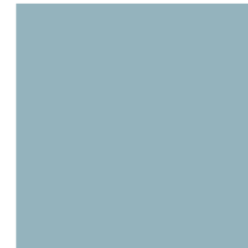
Nepal 33200 - Fresh Start