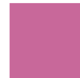
Pale Violet Red 53470

We have created this futuristic collection which mimics the mystery and boldness of the world. Daring, bright and vivid shades of fuchsia, blue and yellow interact well with a mesmerizing champagne shade.