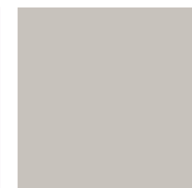
Pale Slate 10961