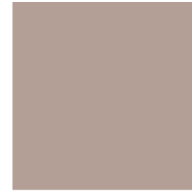
Del rio 55250