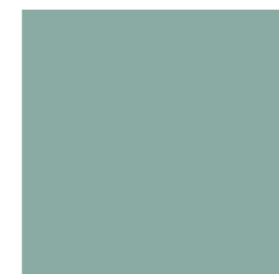
Green Jade 43770