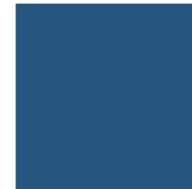
Blue Lagoon 35260