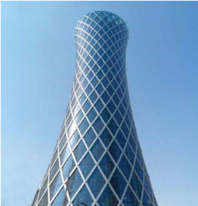
المشروع برج تورنادو