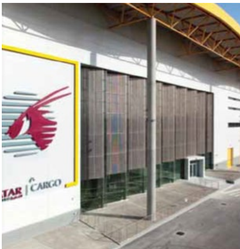
المشروع محطة شحن مطار حمد الدولي Project Hamad International Airport Cargo Terminal