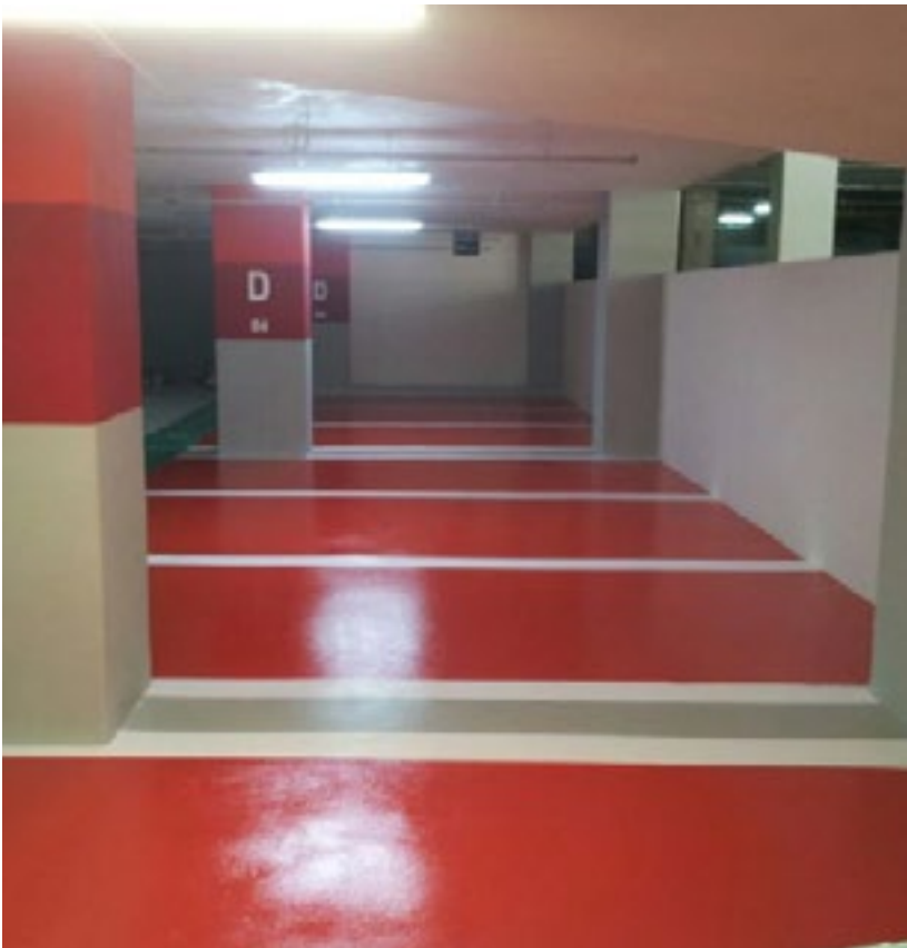
المشروع تمديد المرحلة الثالثة من طلاء الأرضيات - مسقط جراند مول

Project Floor Coating Phase III Extension - Muscat Grand Mall