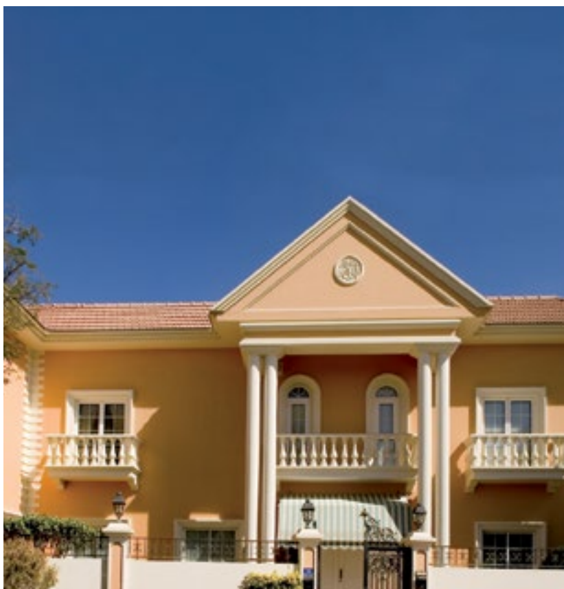
المشروع فيلا خاصة - البحرين