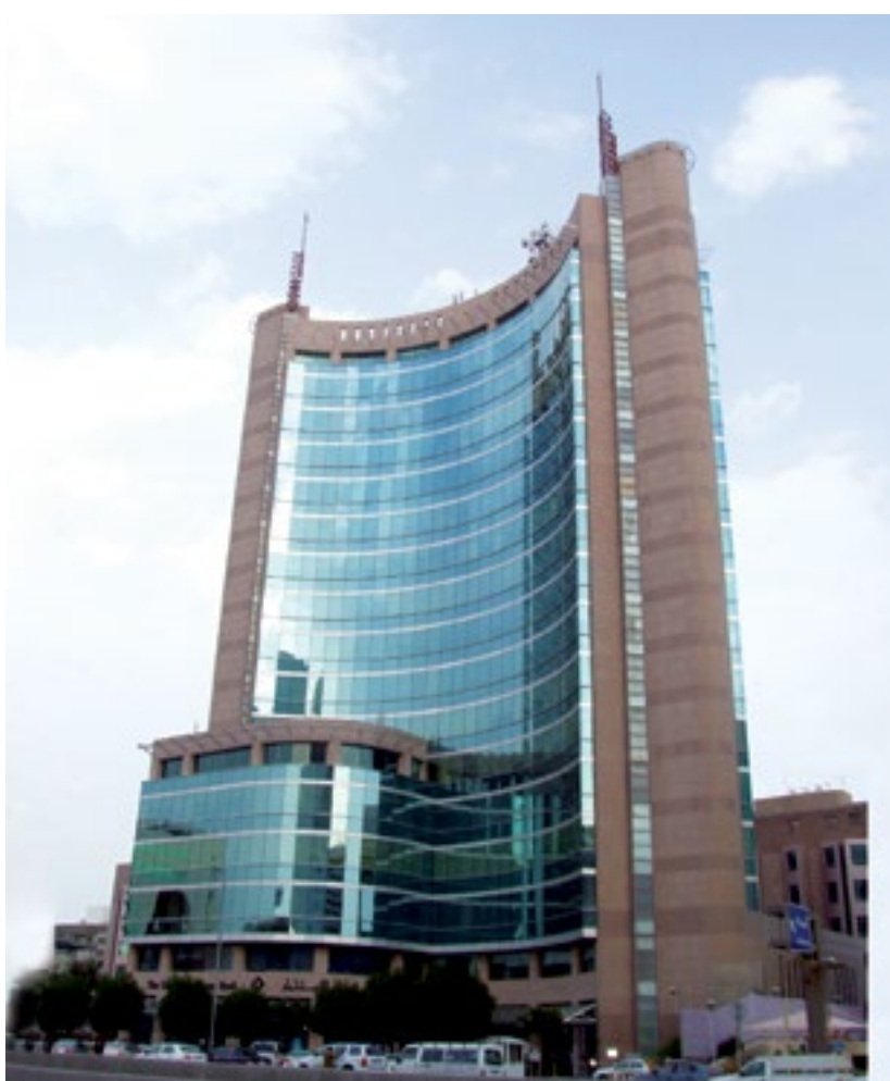
المشروع برج الراشد - الخبر