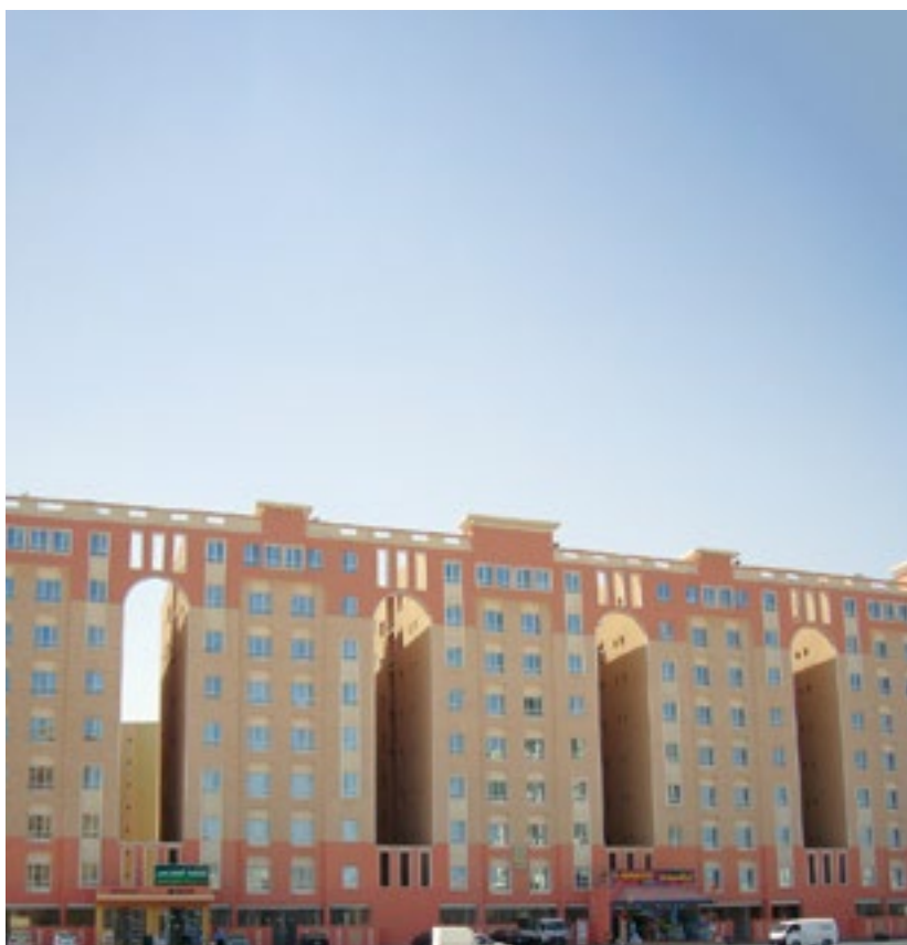
المشروع مجمعات المهبولة - الكويت