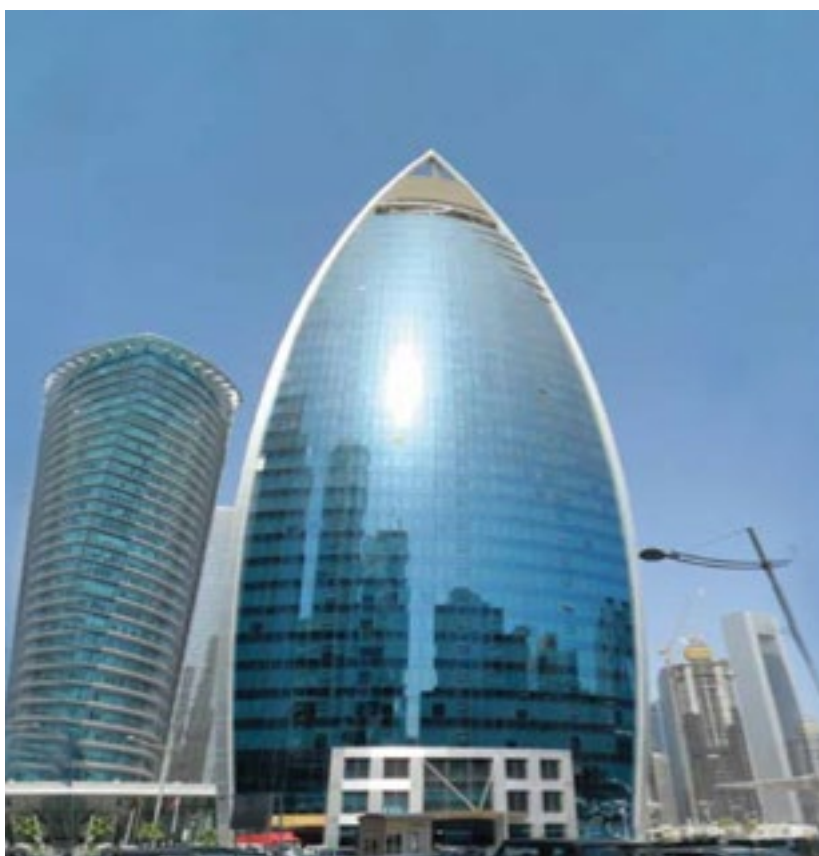
المشروع برج وقود