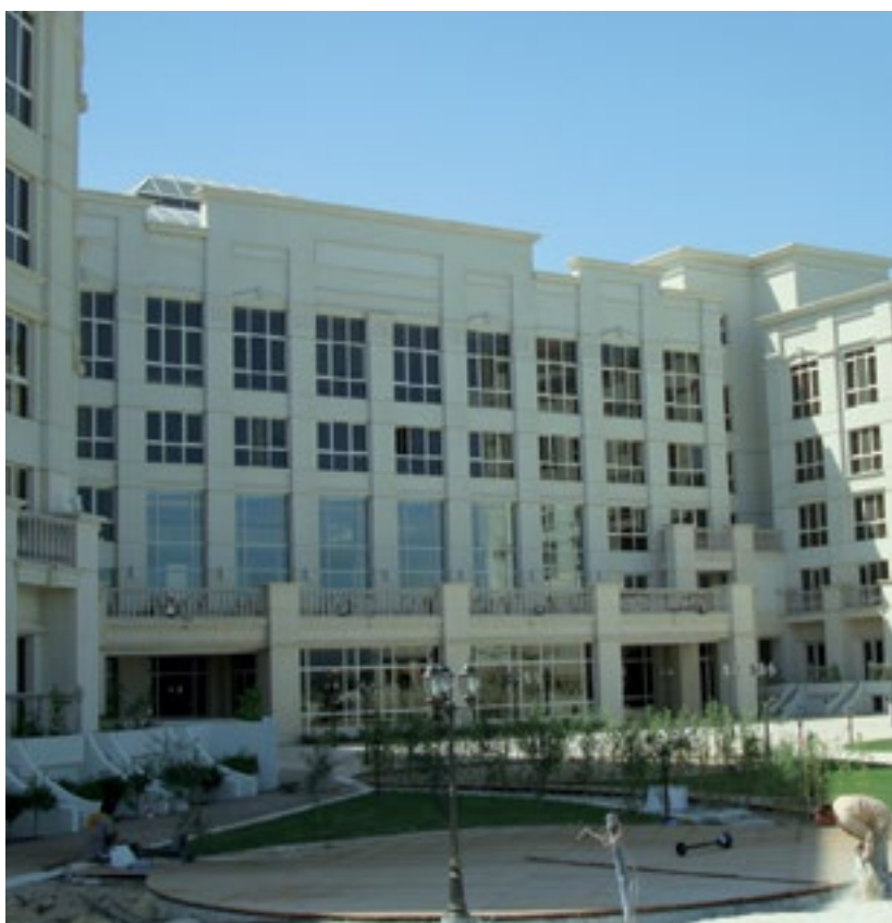
المشروع فندق رجينسي - الكويت