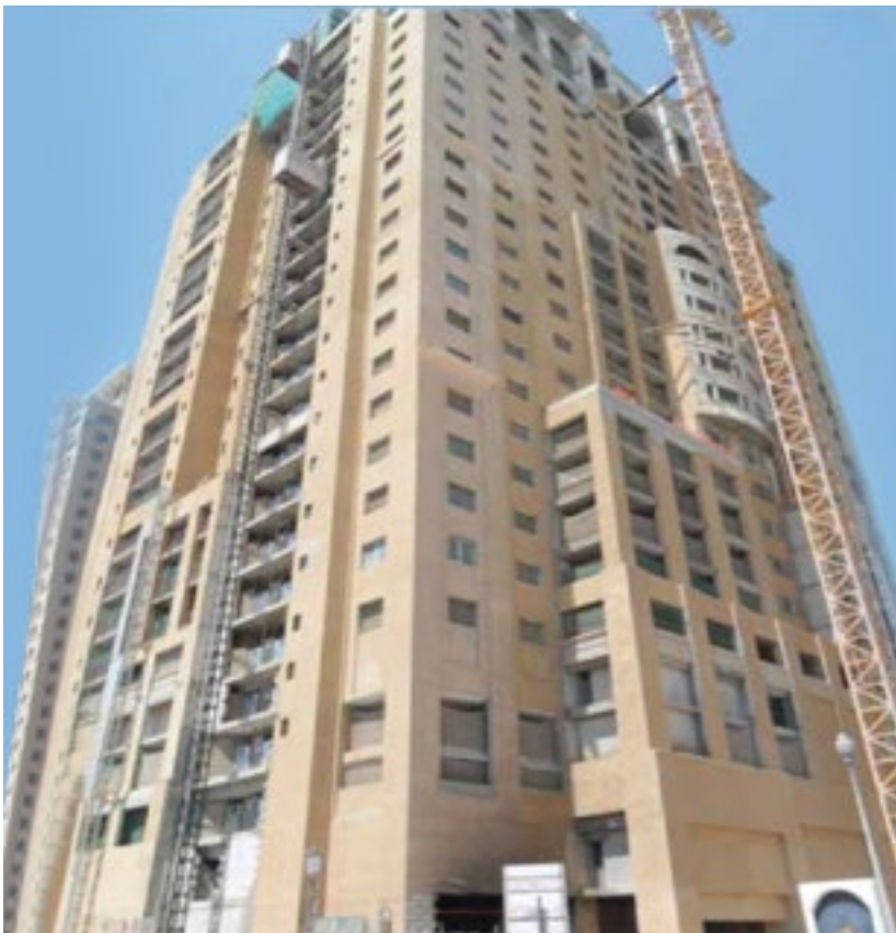
المشروع أبراج اللؤلؤة بورتو أرابيا 16 أ