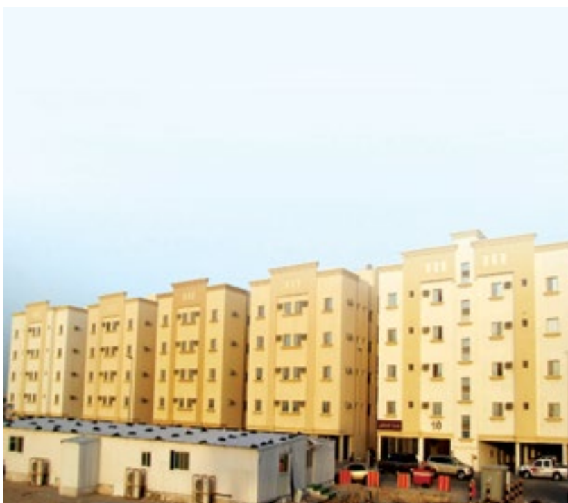
المشروع بناية التمييز - الخبر