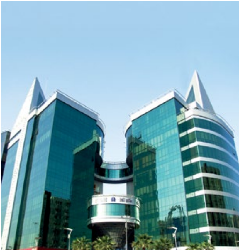
المشروع سكاي تاورز - الرياض