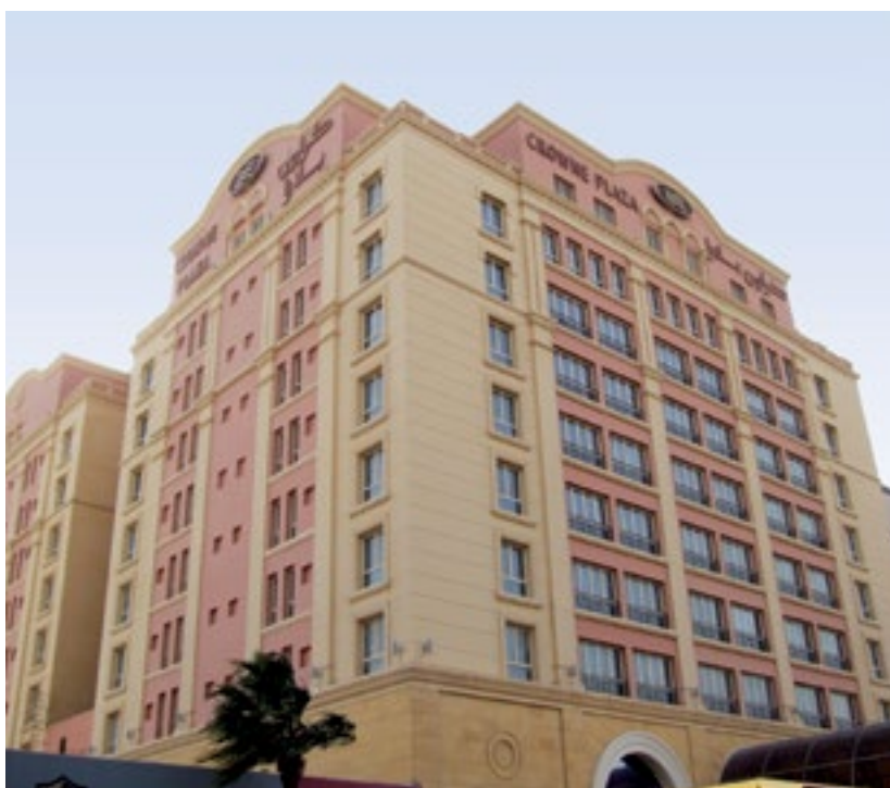
المشروع فندق كراون بلازا - الخبر