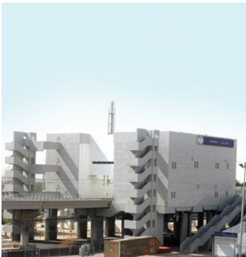
المشروع محطة المشاعر المقدسة منى Project Holy Sites Metro Station Mena