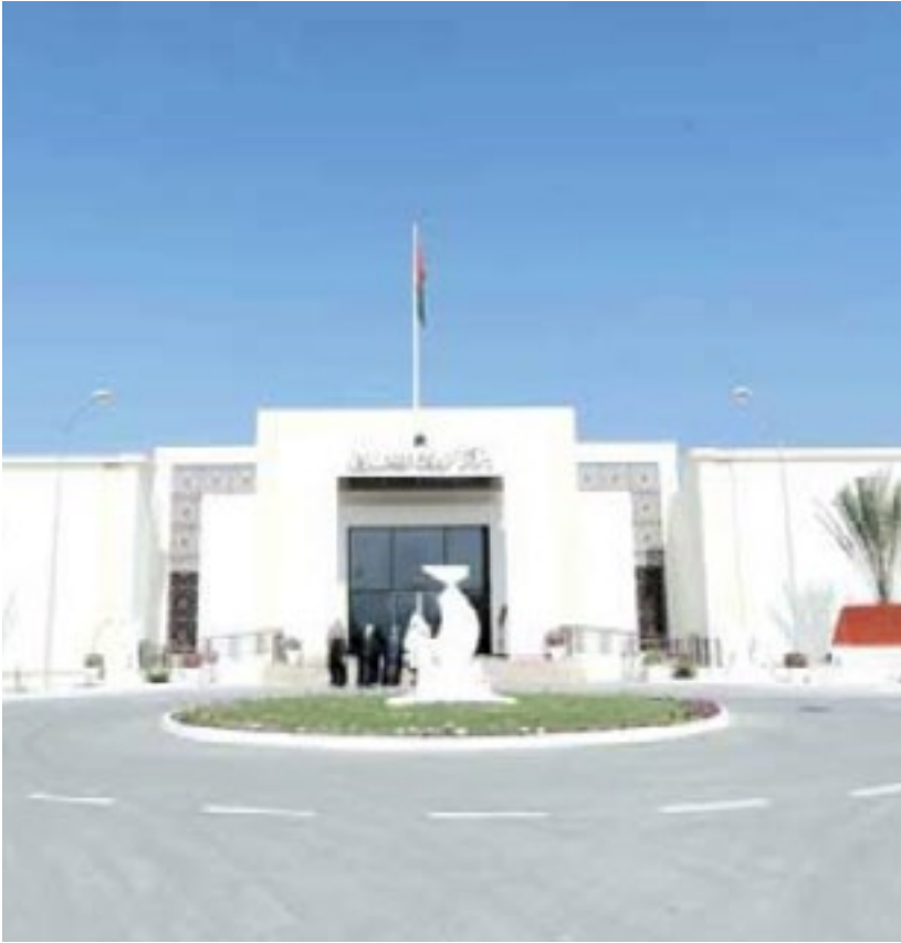
المشروع مركز نزوى الثقافي