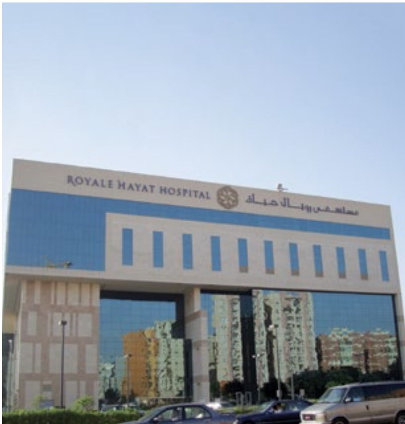
المشروع مستشفى رويال حياة - الكويت