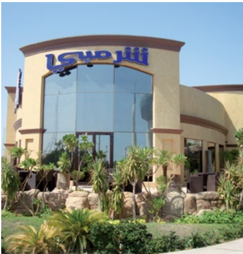
المشروع مطعم شريمبي - الكويت