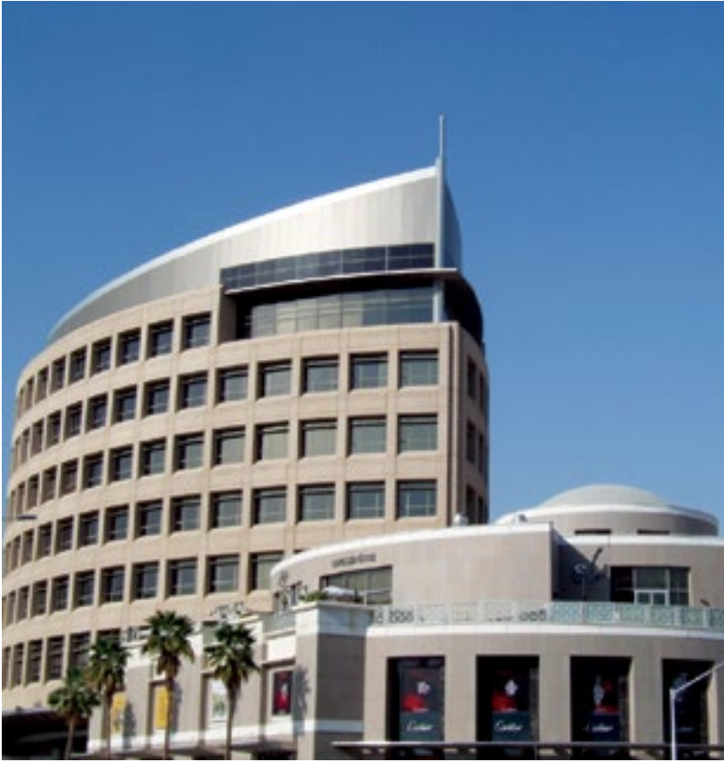
المشروع سنتريا مول - الرياض