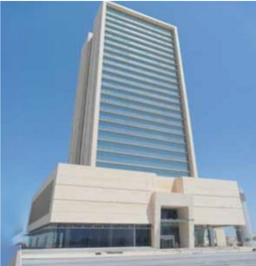
المشروع برج د. علي فتيس