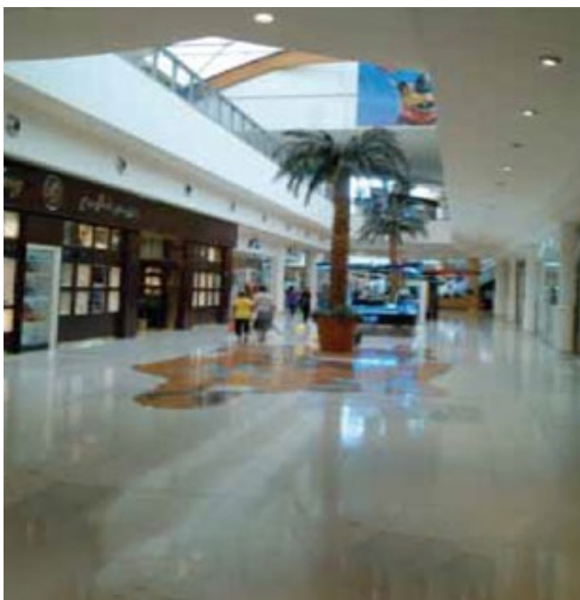
المشروع مركز صحارى