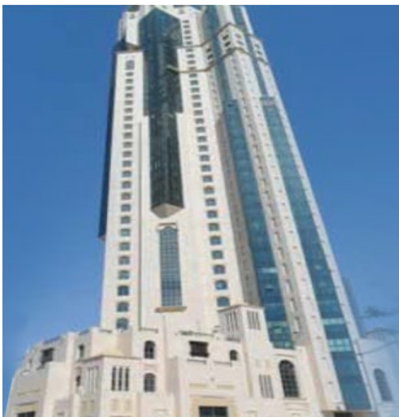
المشروع برج الجاسمية