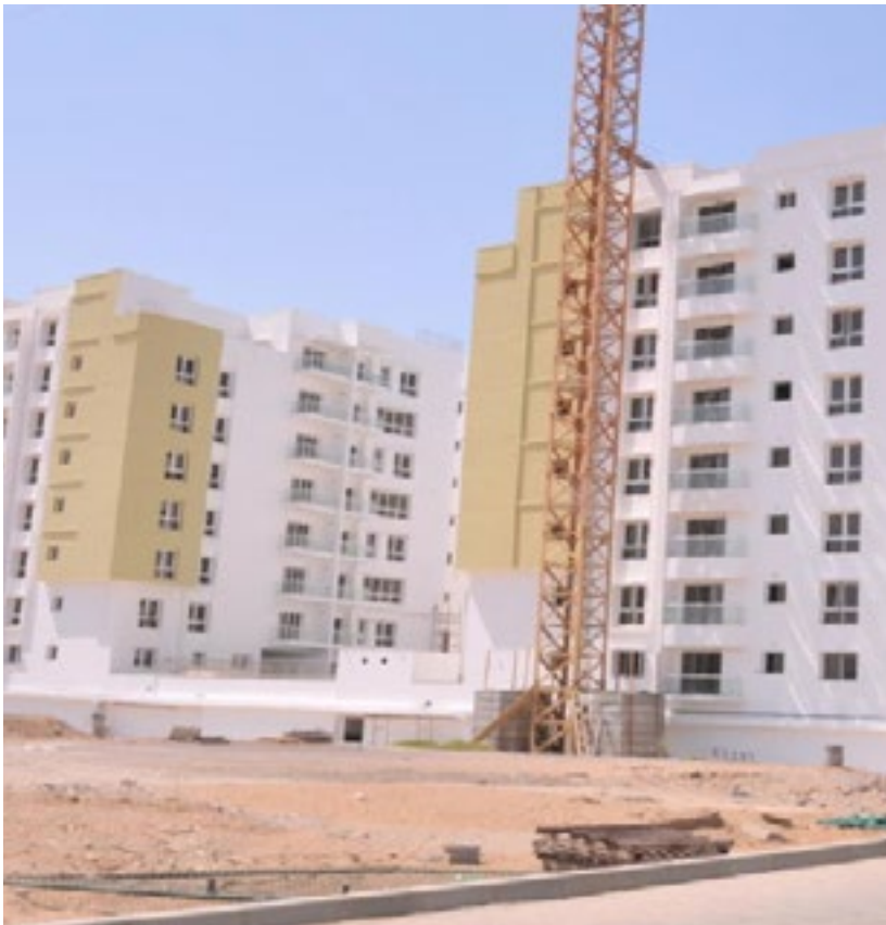
المشروع ٨ أبراج مجمع شادن الحيل - الحيل

Project 8 Towers, Shaden Al Hail Complex - Al Hail