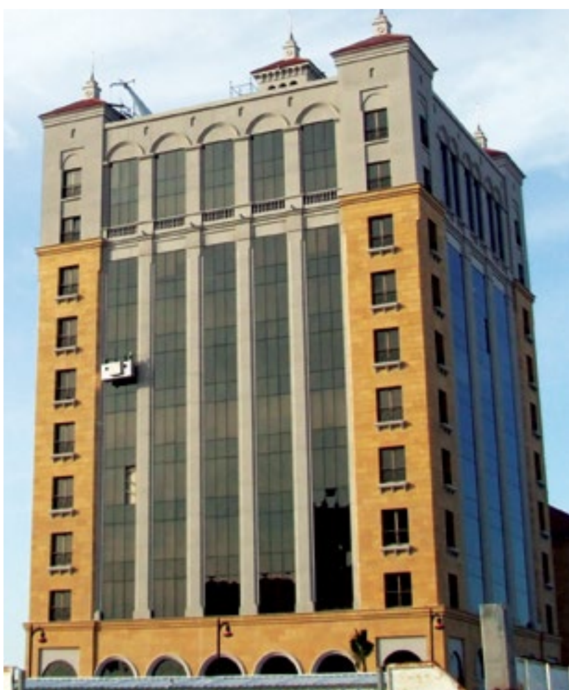
المشروع برج الموسيقى - الخبر