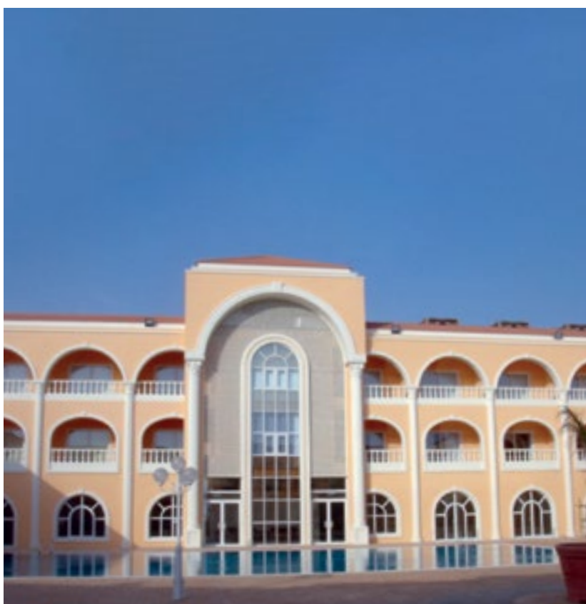
المشروع مجمع فال - أبهر Project Fal Compound - Ubhur