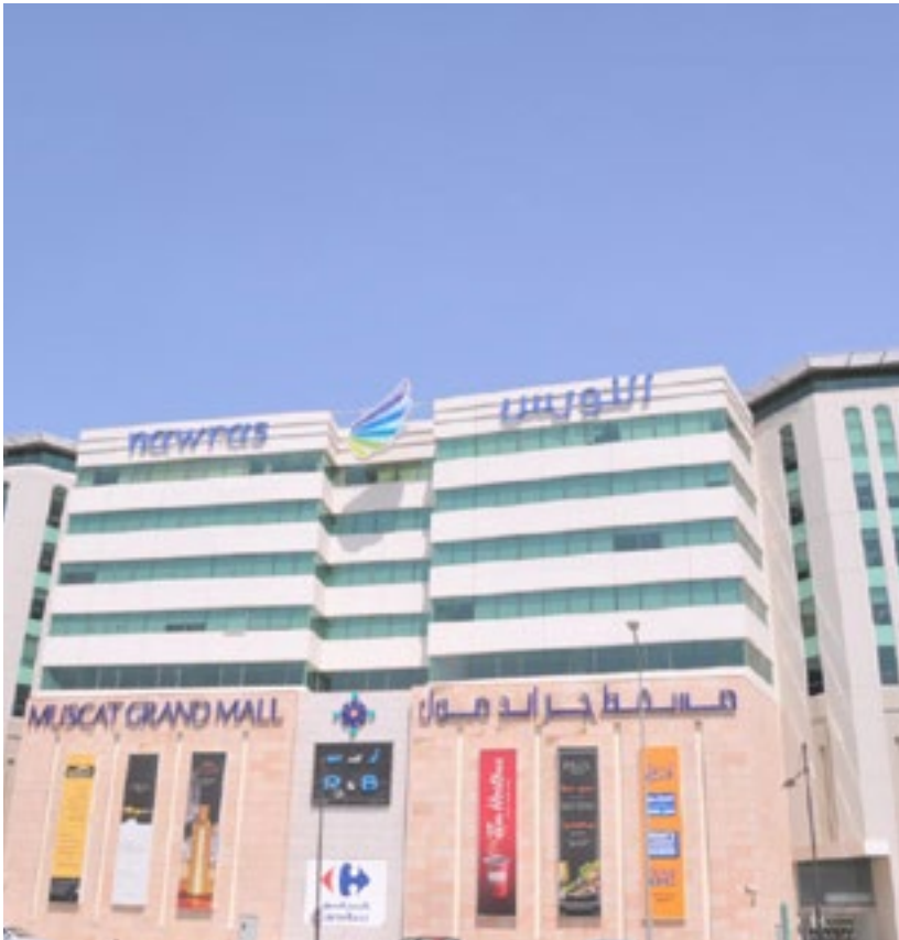
المشروع توسعة مسقط جرانند مول