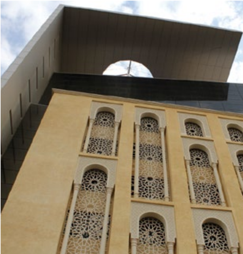
المشروع برج بن هندي العليا الرياض