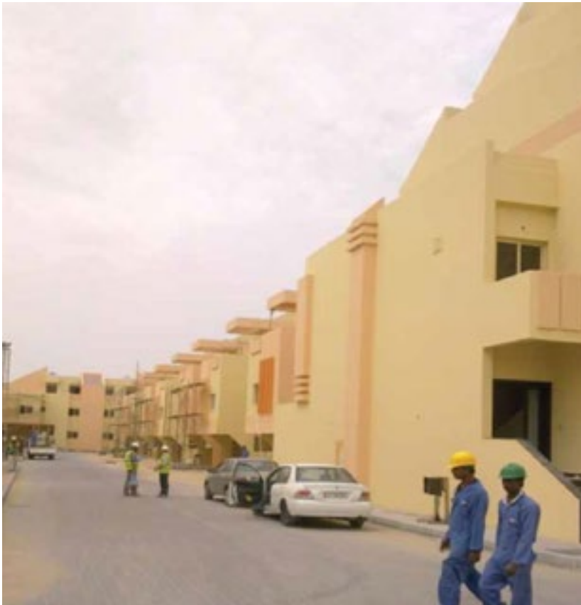
المشروع مجمع 100 فيلا - مدينة خليفة

Project 100 Villa Compound - Madina Khalifa