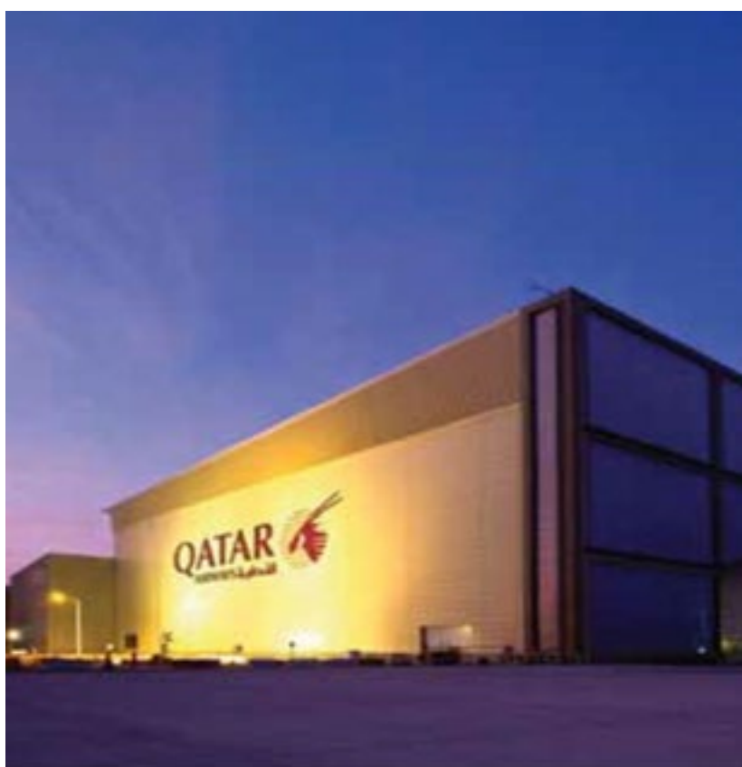
المشروع مطار حمد الدولي - صيانة الحطائر Project Hamad International Airport Maintenance Hangars