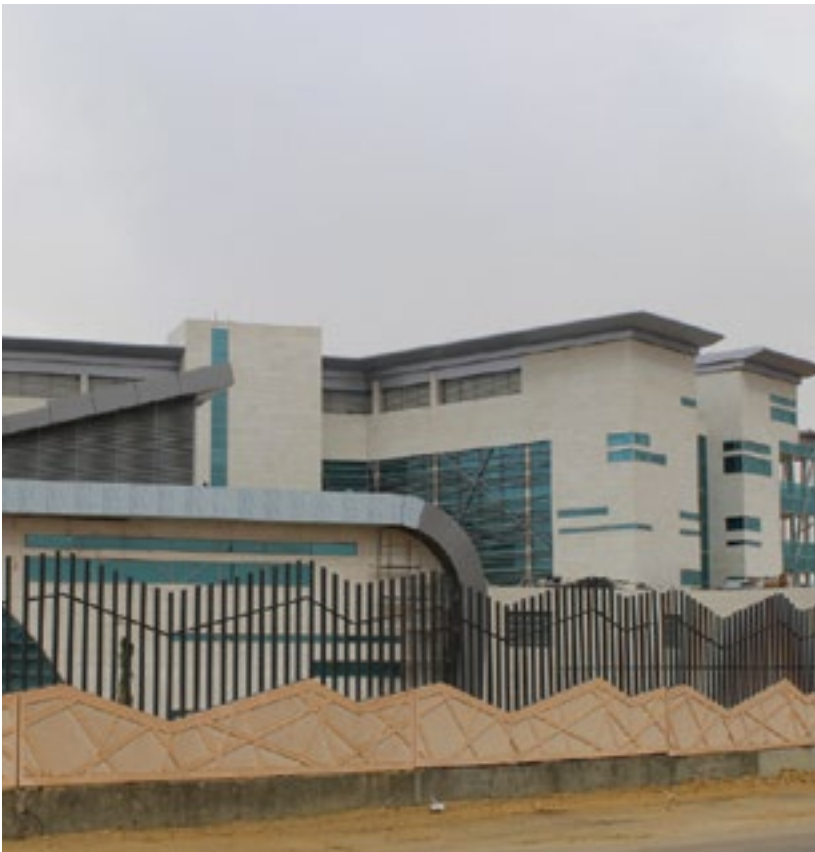
المشروع مركز سابك لتطوير تطبيقات البلاستيك الرياض

Project SABIC Plastic Applications Development Centre (SPADC)