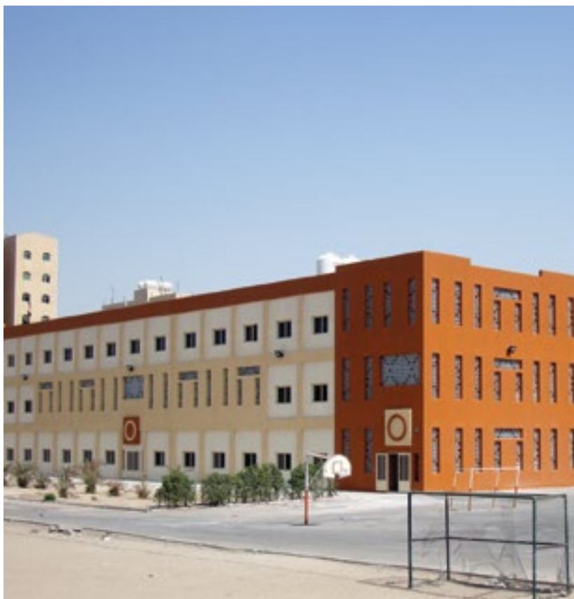
المشروع مدارس الفروانية - الكويت