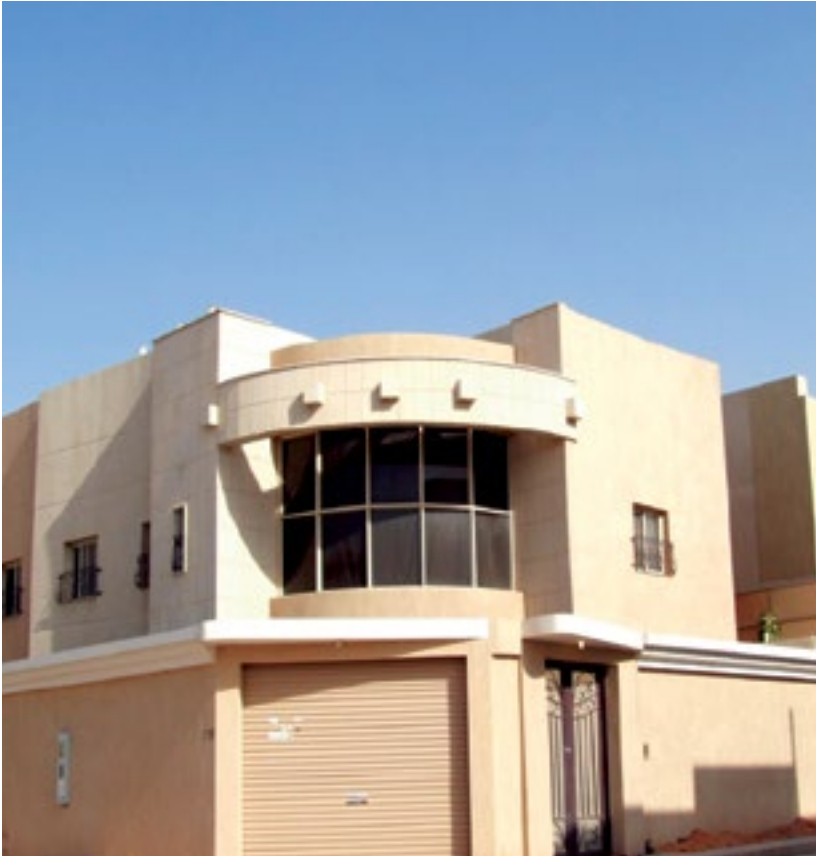
المشروع فلل العلي - الرياض