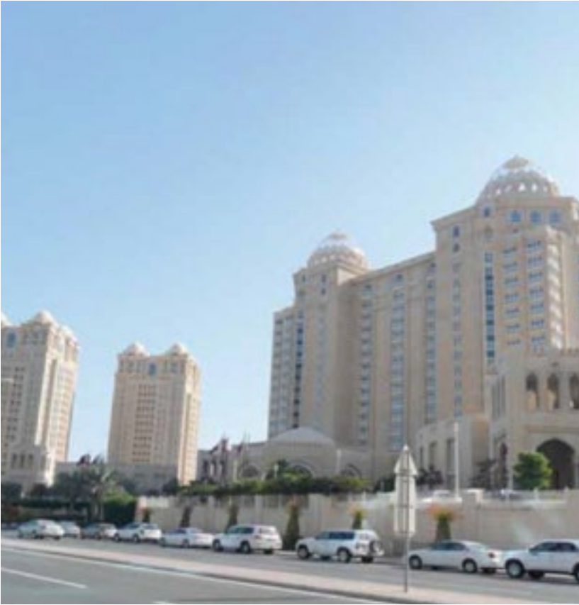
المشروع فندق فور سيزون