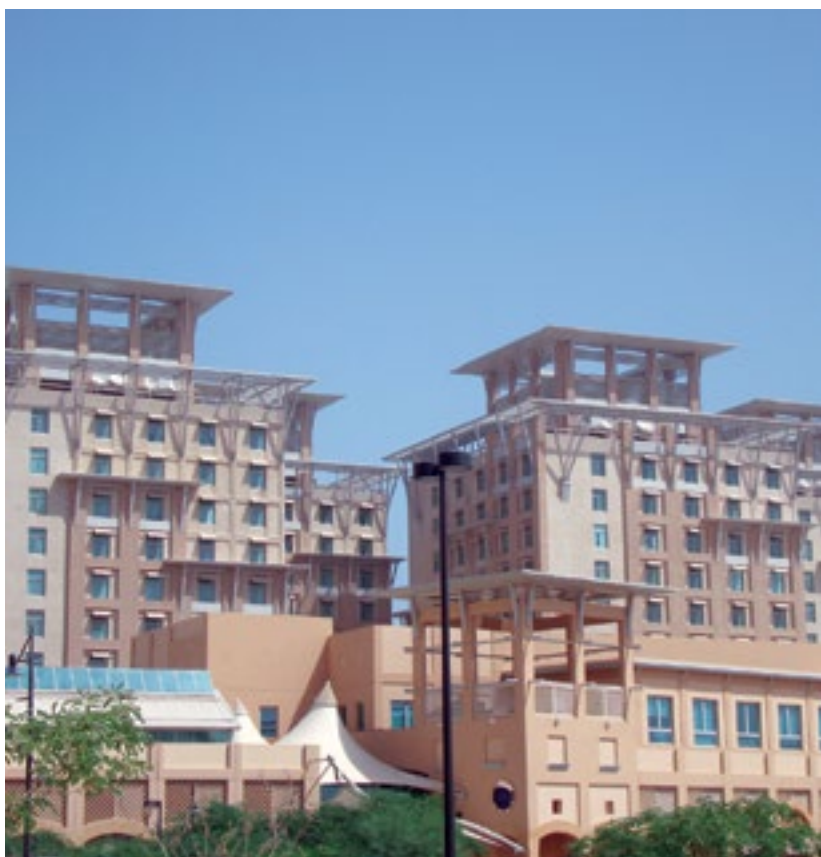
المشروع فندق المنشر روتانا - الكويت

Project Al Manshar Rotana Hotel - Kuwait