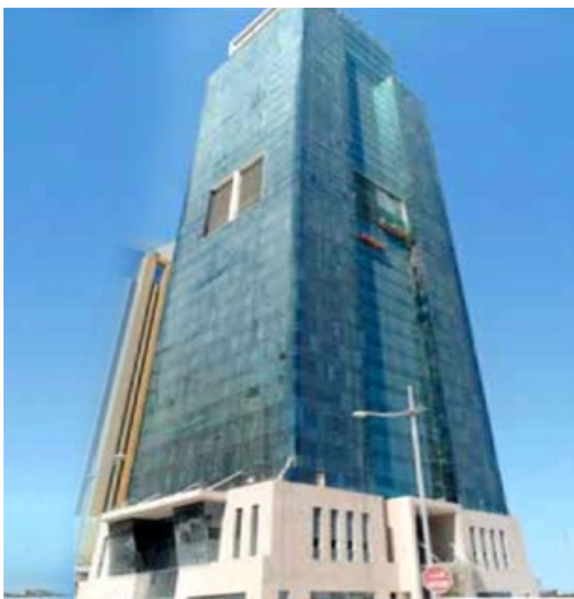
المشروع برج التجار