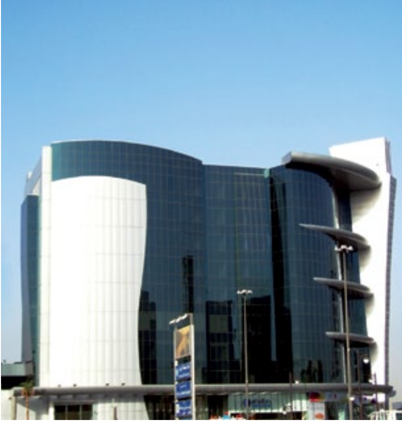
المشروع بناية العنود - الرياض