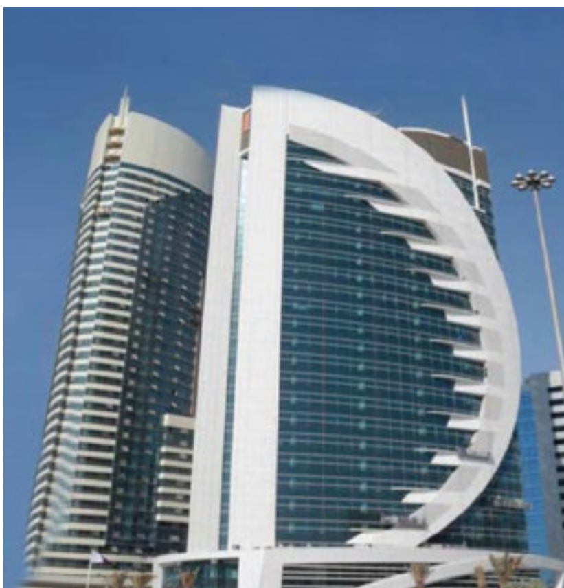
المشروع بنك الدوحة