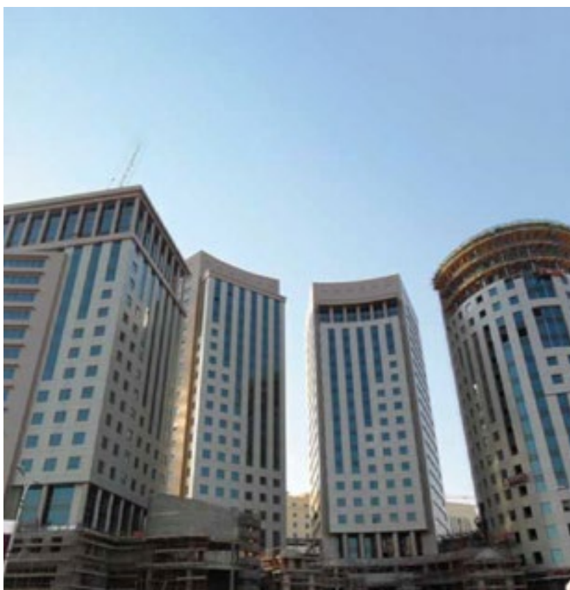
المشروع برج بروة السعد